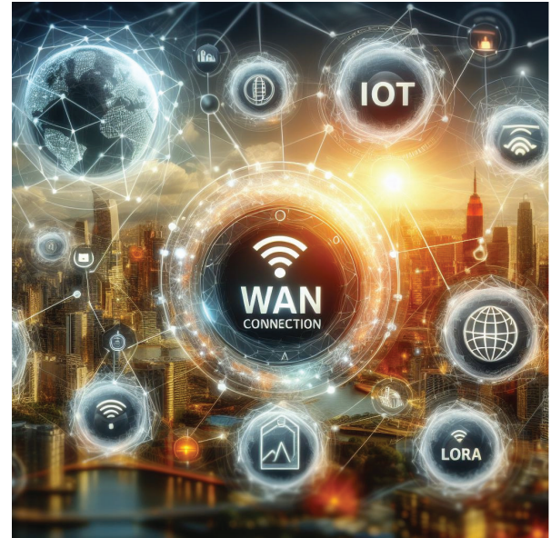
ILUSTRACIÓN 2. Red LORA ILLUSTRATION 2. LORA network

calidad del agua conectados a redes LoRa y NB-IoT pueden medir parámetros como el pH, la turbidez, la temperatura y la concentración de contaminantes. Esto permite a los operadores identificar y prevenir la contaminación del agua, así como garantizar el cumplimiento de los estándares de calidad establecidos por las autoridades reguladoras.